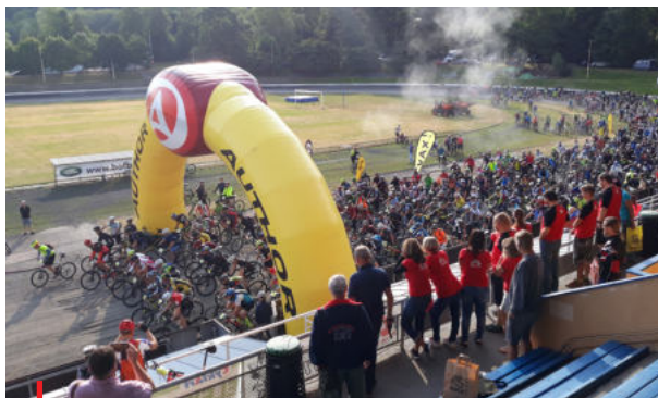
Kopřivnický drtič patří k nejpobulárnějším závodům horských kol.

Kromě vypsání programu během ledna KO ČÚS Moravskoslezského kraje provedla už také sběr žádostí, jejich vyhodnocení, kontrolu a schválení výpočtu i příspěvků konečným žadatelům z řad sportovních klubů, tělovýchovných jednot, tělocvičných jednot, fotbalových a hokejových klubů. Jejich počet se opět navýšil na 505. individuální žádost o dotaci se bude zabývat Zastupitelstvo Moravskoslezského kraje v březnu. V případě schválení garantuje KO ČÚS připsání příspěvků na bankovní účty všem žadatelům v březnu a dubnu 2021.